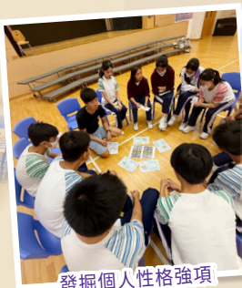
發掘個人性格強項