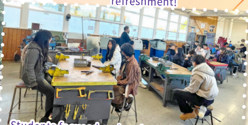
Students focused on hands-on learning in the workshop, collaborating on projects as sunlight fills the room through large windows