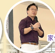
家偉 Sir 分享見證