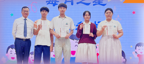
9月之星：主動積極（高中）