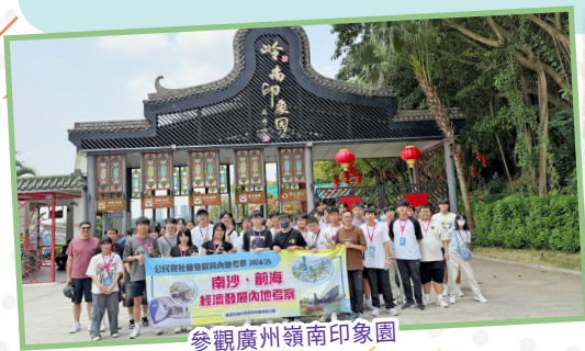
參觀廣州嶺南印象園