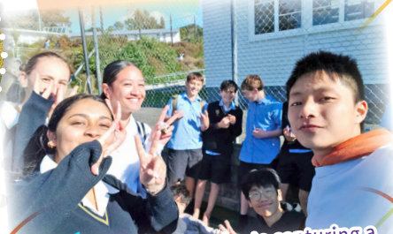
A lively group of students capturing a fun selfie, all smiles and peace signs, enjoying a day outside at school