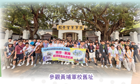
參觀黃埔軍校舊址