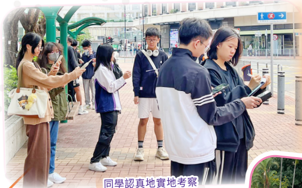
同學認真地實地考察

今次地理實地考察非常有趣。我們透過在荃灣的實地考察，更具體地了解城市及海岸環境，亦加深了對各種數據收集儀器的認識。中心導師在考察途中常提醒我們需注意的常犯錯誤，又在課堂上以幽默的方式指導，讓我們印象深刻，我們亦學會了如何運用資料與繪圖技巧應對 DSE 題目。這次考察讓我獲得理論以外的寶貴知識，加深對地理科的學習興趣，整體體驗十分良好。