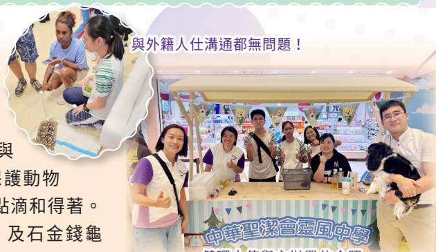
與外籍人士溝通都無問題！

除了學生大使外，本校領養的鬆獅蜥「樹皮」、豹紋陸龜「古惑仔」及石金錢龜「香港仔」亦有出席活動，讓公眾有機會與這些異寵親身接觸。