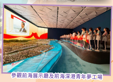
參觀前海展示廳及前海深港青年夢工場