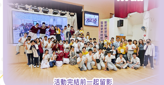
活動完結前一起留影