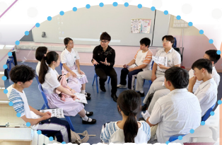
嘉賓分享行業喜與樂

活動當天，「真人圖書」與學生進行面對面交流，分享各行業的發展歷程與實務經驗，不僅協助學生深入認識不同職業的真實生態，也促進兩代人之間的相互了解與經驗傳承。學生積極參與，在深度交流中探索職涯、確立方向。