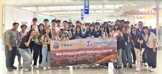
Let's take a group photo together

From July 19 th to 26 th , 2025, ten of our S.4 and S.5 students embarked on a transformative Summer Study Program to New Zealand. As their accompanying teacher, I had the privilege of witnessing a week of incredible cultural and academic immersion, an experience that exceeded all our expectations.