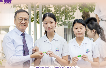
校長授章給予總領袖生