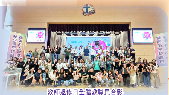
教師退修日全體教職員合影

新一學年從「瘋」開始。全體教職員聚首一堂，透過詩歌、證道、團隊建立的活動，在開學前彼此建立信任和關係，一起邁進新學年。願我們這群「瘋狂」有愛有力的同工，成為靈風中學一份珍貴的禮物，能夠透過我們的服侍，把天父的愛帶給每個學生和家庭。