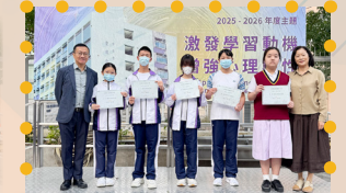
兩期測試金獎得獎合照 初中