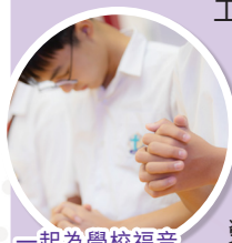
一起為學校福音事工祈禱

本年度的「基督徒大會」（已於9月19日順利舉行）。師生一起以詩歌、經文、祈禱和立志，把本年度的福音事工、靈風人的生命、學生和教職員的需要交托予上主。盼我們能在靈風中遇見上主，在校園中勇於實踐信仰，做好個人見證，榮耀上主。