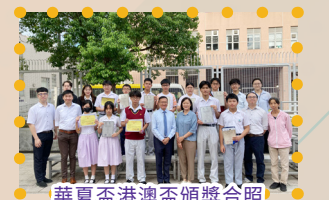
華夏盃港澳盃頒獎合照

本校多名學生於「華夏盃全國數學奧林匹克邀請賽」及「港澳盃數學競賽」中發揮超卓，勇奪多個獎項。學生積極參與校外比賽，堅持不懈，一步步晉身總決賽。過程中，他們不僅增長了見識，也增強了自信心。不少學生都享受比賽的過程，勇於嘗試，樂於挑戰，成功奪獎更是錦上添花！