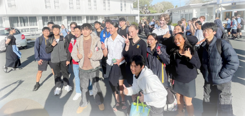
Students posing with enthusiasm outside the school, showcasing their camaraderie and excitement for the day ahead