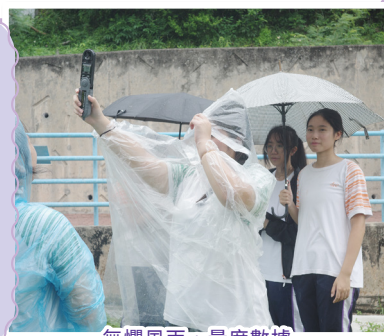
無懼風雨，量度數據