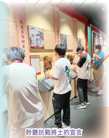
聆聽抗戰將士的宣言

這次內地考察活動不僅拓寬了學生的視野，也讓他們在親身體驗中深化了對國家發展的理解，是一次兼具教育意義與團體回憶的寶貴經歷。