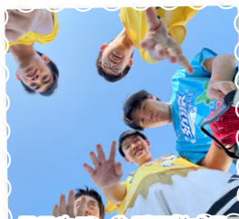
男子中五、六冠軍隊成員