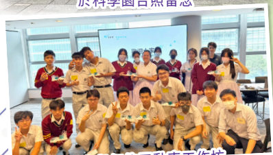
學生參與氫能電動車工作坊