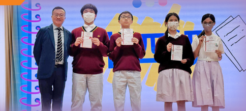
10月之星：儀容端莊（高中）