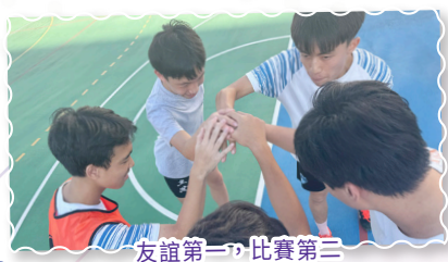
友誼第一，比賽第二