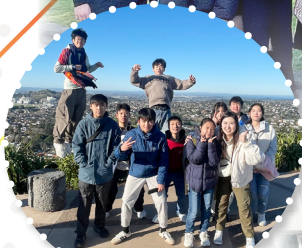
The group enjoying a sunny day at the viewpoint, celebrating with joyful poses against a stunning backdrop of the city skyline