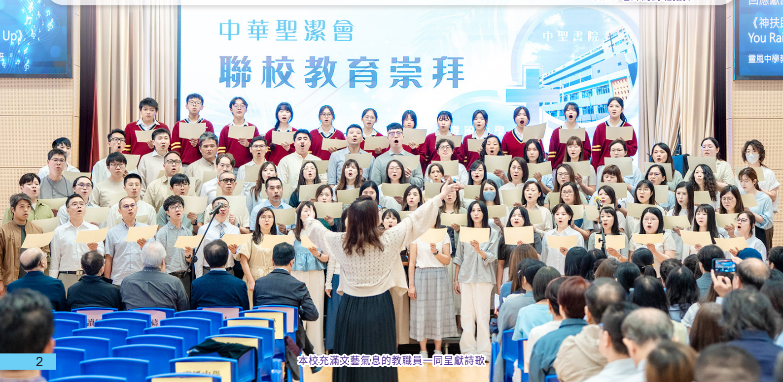
本校充滿文藝氣息的教職員一同呈獻詩歌