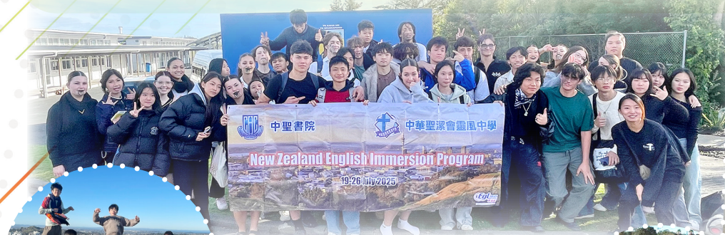
A vibrant group photo with local students, capturing the spirit of friendship and culture exchange