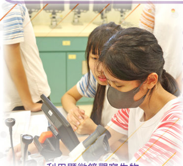
利用顯微鏡觀察生物

這次林地考察讓我對林地生態系統有更深入的了解。通過觀察不同植物的生長環境和特徵，我認識到生態因素對生物生長的影響，這些觀察加深了我對生態學的理解。在研習的過程中，我們分工協作，使數據收集和分析更具效率。大家互相分享觀察所得與思考，大大提升了我對生物學的興趣。