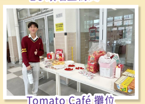
Tomato Café 攤位