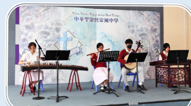
The Chinese Orchestra performed wonderful music during the activity