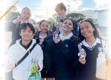
Local students beaming with joy as they proudly display the thoughtful gifts brought by our students, celebrating friendship and cultural exchange