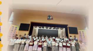
數學自學考章計劃頒獎合照 初中