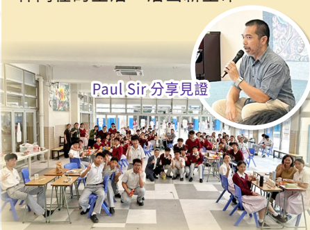
Paul Sir 分享見證