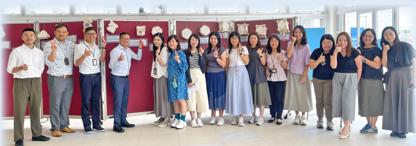
Let's celebrate the Mid Autumn Festival together