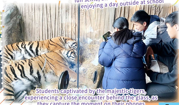
Students captivated by the majestic tigers, experiencing a close encounter behind the glass, as they capture the moment on their phones