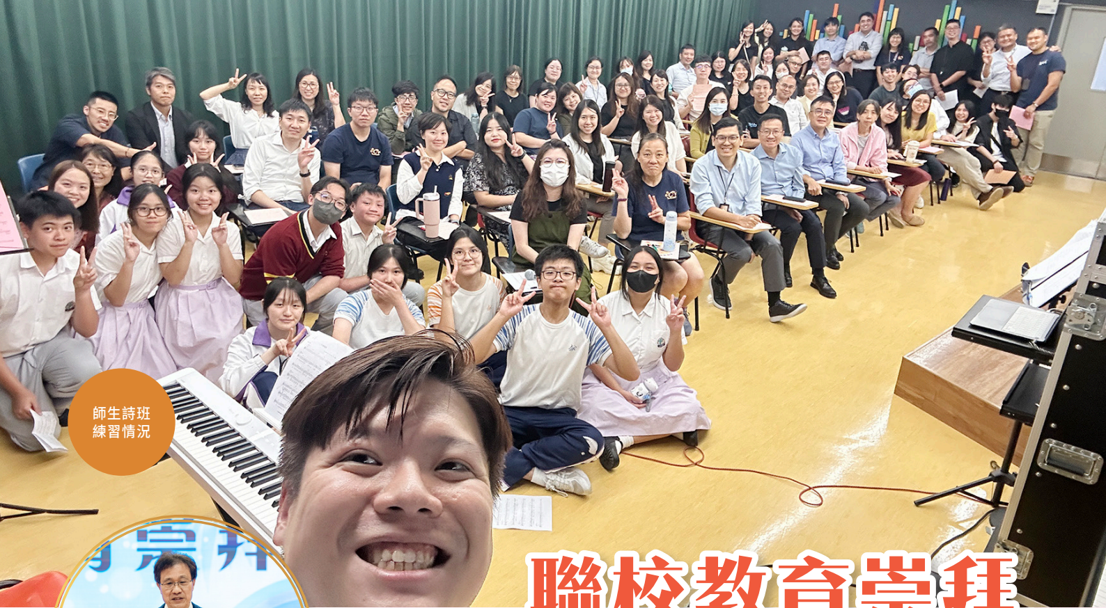
師生詩班 練習情況