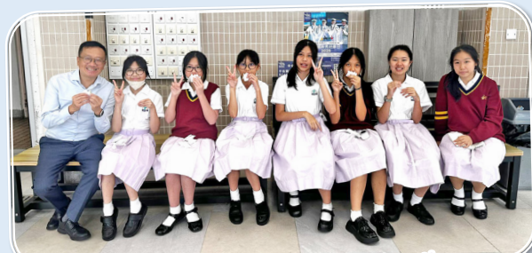
Enjoying the mochi-ice cream together