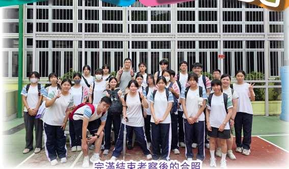
完滿結束考察後的合照

中六級修讀生物科的同學，於九月前往長洲明愛陳震夏郊野學園進行野外考察，是次活動讓學生有機會走出課室，實踐課本知識，加深對學科的理解。活動期間，學生親身運用不同的儀器收集數據，分析不同的環境因素如何影響生物的分佈和活動。另外，學生亦有機會接觸很多平日鮮見的生物，將牠們帶回實驗室觀察，甚至親自設計實驗以研究這些生物的習性。