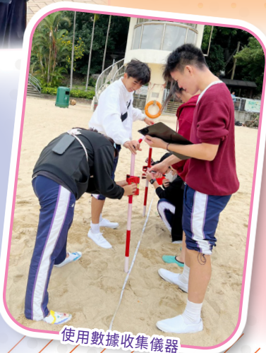
使用數據收集儀器

這次地理考察使我們獲益頗多。首先，讓我們得以走出教室，將課本知識與真實場景連結；這兩天的所見所聞讓我們獲益匪淺，透過親身體驗，加深了對地理科的實際理解。其次，在考察過程中，我們也深刻明白團隊合作的重要性——雖然過程難免有些疲憊，但每一個數據的背後，都是團隊中每個人的努力與相互配合，這讓我們收穫了難以言喻的成就感。因此，我非常高興能參與本次考察。