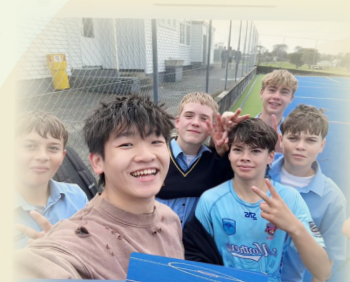
A fun selfie with rugby buddies, celebrating friendship and teamwork on the field, topped off with a little post-game refreshment!

The success of this program was evident in the visible growth of each student. I watched as they evolved from hesitant visitors into confident global citizens, navigating a new culture with grace and curiosity. This wonderful experience was made possible by the incredible hospitality of Rodney College and the generous host families. We returned to Hong Kong with not just souvenirs, but with broader horizons, new friendships, and memories that will undoubtedly inspire our students for years to come.