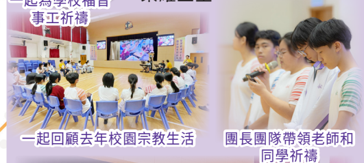
一起回顧去年校園宗教生活