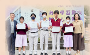
兩期測試金獎得獎合照 高中