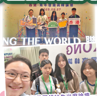
天一老師帶同領袖生出席論壇

民政及青年事務局於2025年9月27日舉辦第二屆香港青年發展高峰論壇。論壇以「聯通世界 跨越未來」為主題，匯聚來自不同地區主管青年政策的主要領導官員及來自不同領域的業界翹楚擔任演講嘉賓，有超過3 000名青年參加，當中有約600人來自中國內地和33個海外國家，包括美國、馬來西亞和卡塔爾等，就青年關心的議題互相交流。