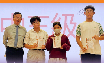
9月之星：主動積極（初中）