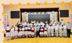
數學自學考章計劃頒獎合照 高中