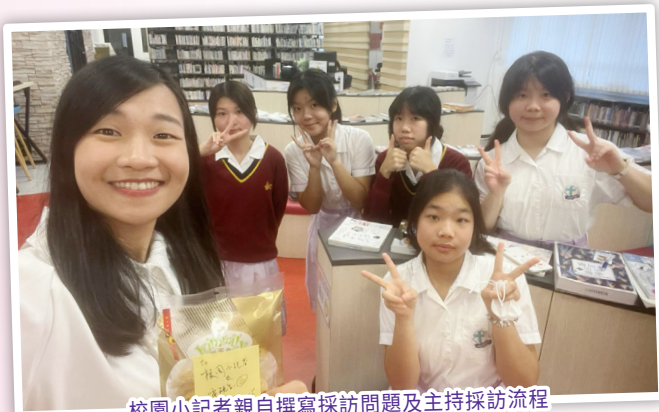
校園小记者親自撰寫採訪問題及主持採訪流程