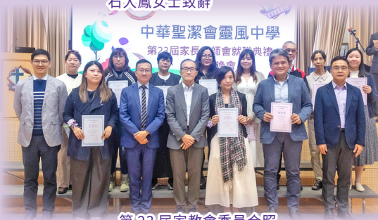
第23屆家教會委員合照