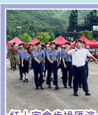
紅十字會步操匯演