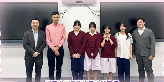
講座後同學與講者合照交流