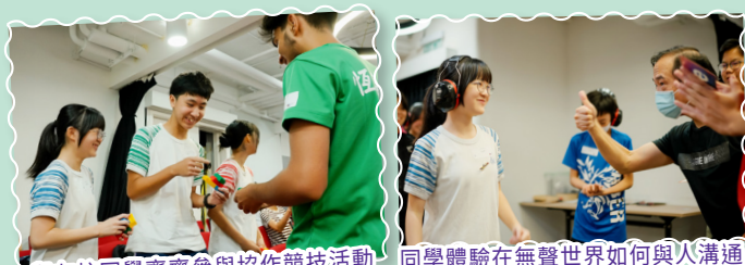
與友校同學齊齊參與協作競技活動

在典禮日，YO達人更走進全黑暗及無聲的體驗式學習，探索「對話」的真正意義，並與視障導師及聾人導師進行深度交流。最後，他們把成為YO達人的願景與期望寫入「時間錦囊」，為新一年的成長旅程定下方向。