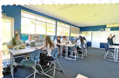
Students engaged in collaborative learning and discussion in a bright, spacious classroom