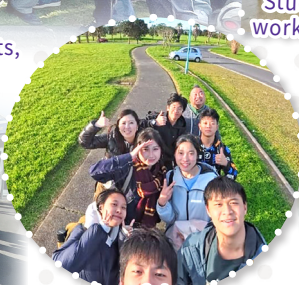
A cheerful group of students capturing the joy of a sunny morning, ready to embrace the day ahead in the beautiful outdoors