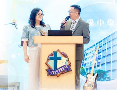
志誠校長及中聖書院陳校長分享兩校感恩事項