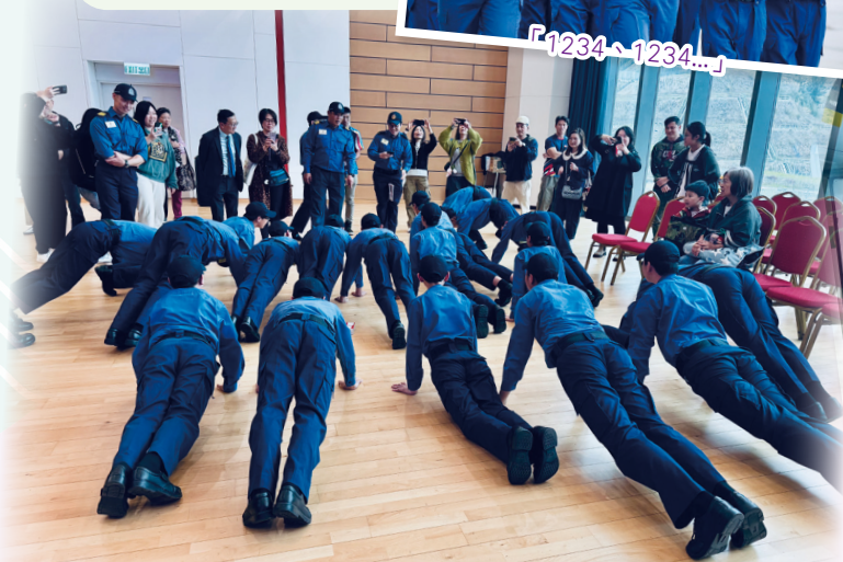
「難捨難忘」的掌上壓