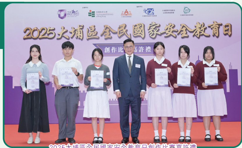
2025大埔區全民國家安全教育日創作比賽嘉許禮