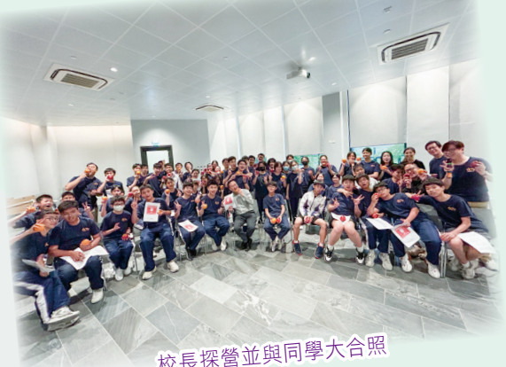
校長探營並與同學大合照