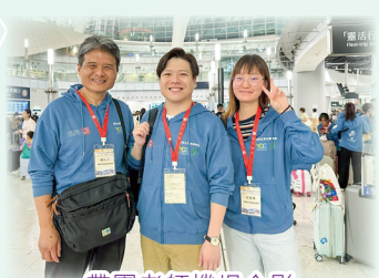
帶團老師機場合影

總結這個交流之旅，大家均大開眼界，親身目睹並體會到國家發展一日千里，留下了深刻印象。