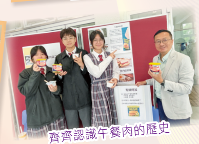
齊齊認識午餐肉的歷史