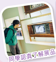
同學認真了解展品