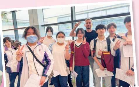
Students enjoyed an exciting and engaging interview session with foreign guests