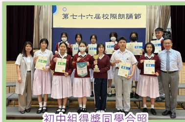
初中組得獎同學合照