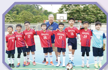
亞軍：港九街坊婦女會孫方中小學