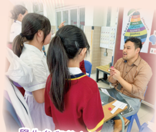
學生參與英文讀經攤位