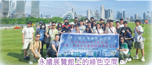
永續展覽館上的綠色空間，可欣賞大自然的藍天白雲與濱海堤壩