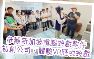
參觀新加坡電腦遊戲軟件初創公司，體驗VR歷境遊戲