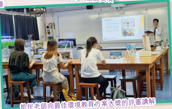
凱民老師向最佳環境教育方案大獎的評審講解