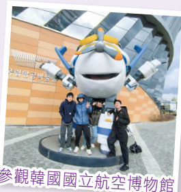
參觀韓國國立航空博物館