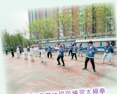
與北京當地居民練習太極拳