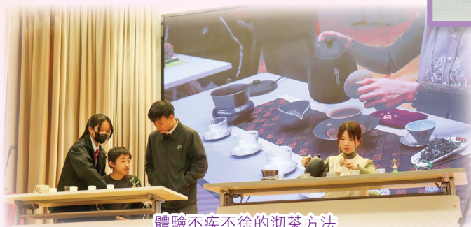
體驗不疾不徐的沏茶方法

豐富多彩的文化周活動，幫助同學們深入認識「餐桌上的文學」，期待來年與大家再聚文化周！