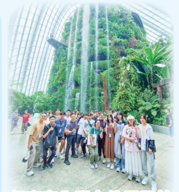
超高室內瀑布的雲霧林