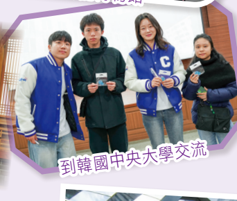
到韓國中央大學交流