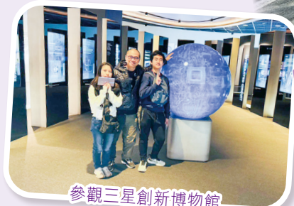
參觀三星創新博物館