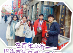
在百年老街——巴洛克街享用冰糖葫蘆是