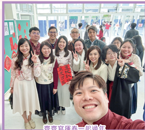
齊齊寫揮春一起過年

周會期間，學校舉辦茶藝講座，同學們不僅了解品茶文化，更親身體驗沏茶方法，激發了對茶葉的興趣。圍繞主題也舉辦了「舊曲新詞」比賽，同學發揮創意寓學習於娛樂。