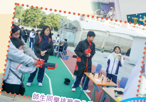
師生同樂挑戰攤位遊戲