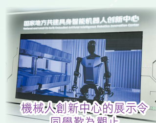
機械人創新中心的展示令同學歎為觀止