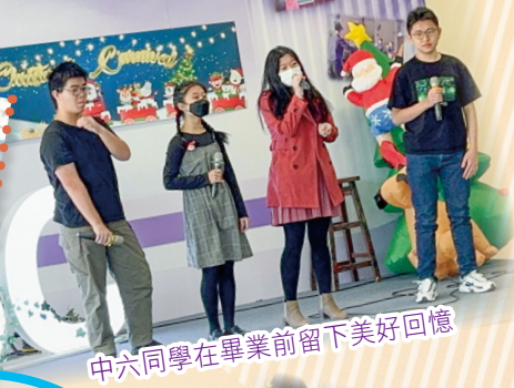
中六同學在畢業前留下美好回憶