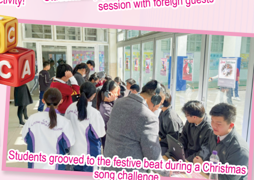
Students grooved to the festive beat during a Christmas song challenge