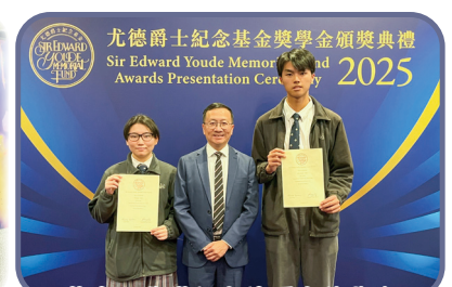
恭喜同學獲得尤德爵士獎學金