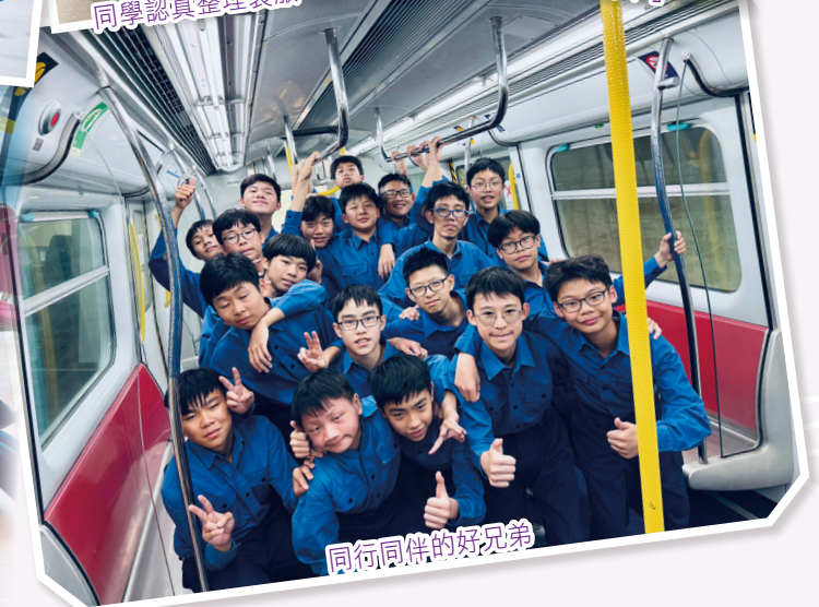
同行同伴的好兄弟