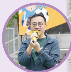
志誠校長勉勵大家要努力追夢

特別感謝大埔區各小學的鼎力支持，為小球員們創造了更多比賽機會。我們期待第四屆「靈風盃」的來臨，盼望見證更多精彩的比賽，讓小球員們在足球的世界裡繼續成長、綻放光芒！