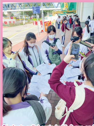
Students collaborated with focus and teamwork to complete their geography group assignment

This semester, the English Department organized a variety of interactive events to enhance students' language skills through cultural and real-world experiences. In December, students celebrated an early Christmas with festive carols and delicious holiday treats, immersing themselves in English holiday traditions. Before the Lunar New Year break, they practiced language skills by exchanging English well-wishes, earning lucky red packets with sweet rewards. Additionally, Secondary 3 students participated in an interdisciplinary field trip to Central, conducting surveys and interviews with foreigners to apply their English and Geography knowledge in authentic settings. These activities not only improved students' speaking, listening, and cultural awareness but also created memorable learning moments. The department looks forward to more exciting language adventures next semester!