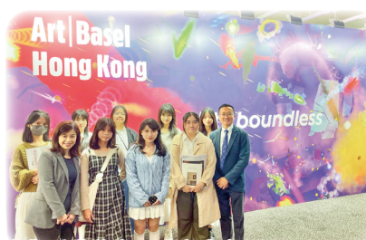
參觀香港藝術界一大盛事——Art Basel