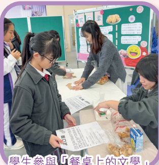
學生參與「餐桌上的文學」午間攤位