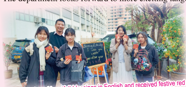
Students shared heartfelt blessings in English and received festive red packets filled with sweet chocolates