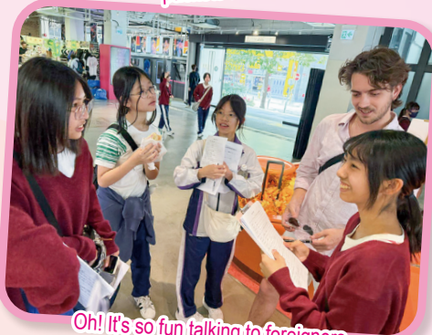
Oh! It's so fun talking to foreigners