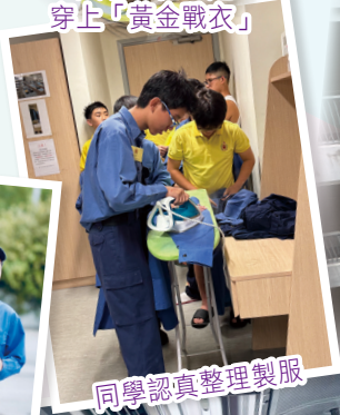
同學認真整理製服