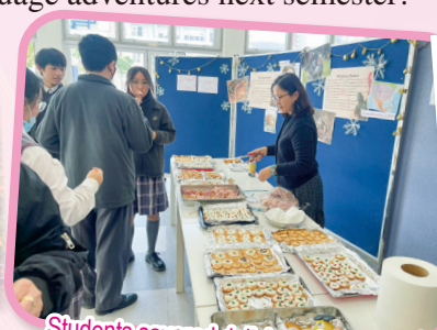
Students savored delicious Christmas treats while enjoying the festive activity!