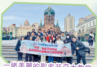
一睹美麗的聖索菲亞大教堂