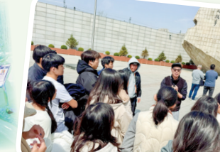
活生生的歷史課——九一八歷史紀念館