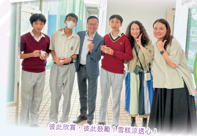
彼此欣賞，彼此鼓勵！雪糕涼透心！

本校年度「全心傳情」活動以「靈風感謝祭」為主題，鼓勵學生透過手作禮物、感恩卡片及相片回顧等方式，向師長、同窗、職員及家人表達謝意。這項活動不僅讓學子反思成長點滴，更凝聚校園溫情，體現「靈風人」互助互愛的精神，讓感恩之心在校園中傳遞延續。