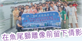
在魚尾獅雕像前留下倩影