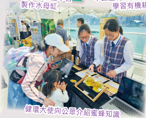
健環大使向公眾介紹蜜蜂知識

本校一直致力於推廣環境教育，透過建立不同的校本課程，例如：水母及蜜蜂飼養、有機耕種、生態瓶製作等，讓學生在課堂中動手參與活動，將課堂知識和環境保育結合，親身體驗生態的重要性。近年，本校亦經常受邀外出分享，並協助友校建立課本環境教育課程，促進了環境教育在學界的發展。本校亦因此榮獲由環境及生態局、環境運動委員會主辦之香港環境卓越大獎（學校界別）——最佳環境教育方案大獎傑出獎，以肯定本校在環境教育方面的貢獻。