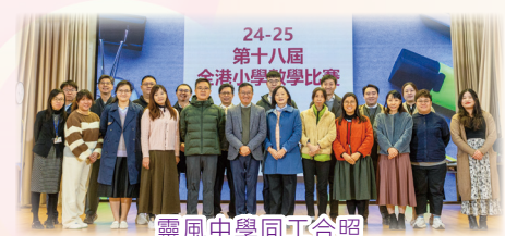
靈風中學同工合照

全港小學數學比賽（大埔區）於2024年12月14日（星期六）舉行，當天大埔區十多間小學的師生到達本校參加比賽。小學生們非常專心認真地應賽，參賽者需通過不同的考核模式，包括個人賽、協作解難和數學急轉彎電腦題。靈風學校的師生亦為是次比賽傾力付出，讓比賽得以順利舉行。