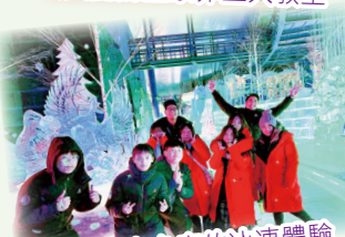
零下十多度的冰凍體驗