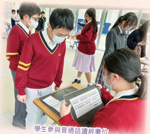
學生參與普通話讀經攤位