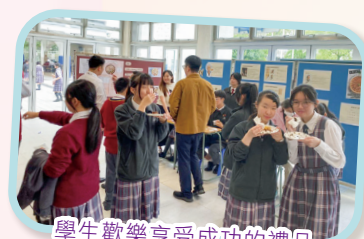
學生歡樂享受成功的禮品