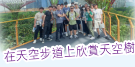
在天空步道上欣賞天空樹

新加坡的廚餘再生科技令我印象深刻，香港若能引進，相信能大幅減少垃圾。但需先加強教育推廣，克服地理限制。