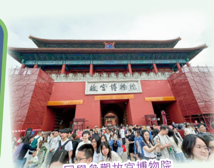
同學參觀故宮博物院