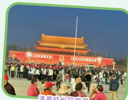
清晨時份同學們到天安門廣場出席升旗典禮