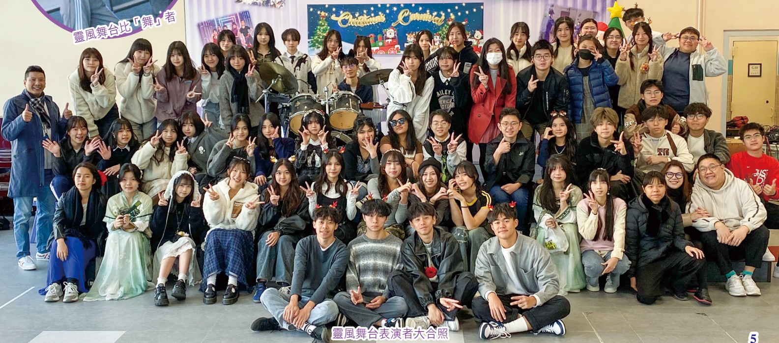
靈風舞台表演者大合照