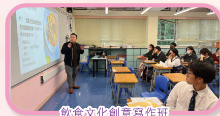
飲食文化創意寫作班

課程以也斯筆下《涼茶舖》、《馬賽的魚湯》等佳作為引，首堂課帶領學生透過五感細膩捕捉飲食之美。其後漸次深入，引導學生從飲食展開聯想、激發創意，進而挖掘其與社區生活的深刻聯繫。每堂課均以精闢的文章導讀開篇，並以生動活潑的方式講授寫作技巧。