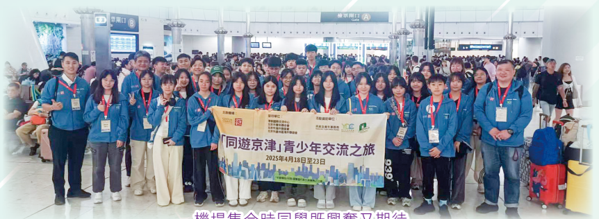
機場集合時同學既興奮又期待

本校二十位中五級同學，聯同大頭副校長、偉豪老師及嘉詠老師，於2025年4月18日至4月23日參加了由百仁基金主辦的「同遊京津」青少年交流之旅，藉此跟北京市及天津市青少年作觀摩及交流。活動目的旨在讓香港青少年透過切身感受祖國山水風光、歷史人文及航天科技發展，引發同學對研究國家科技文化的興趣，並增強他們的民族認同感和自豪感。