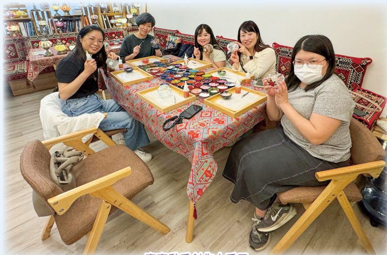
齊齊動手創作小手工