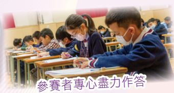
參賽者專心盡力作答