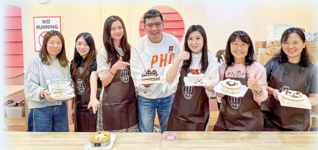
同工享受製作蛋糕的成果