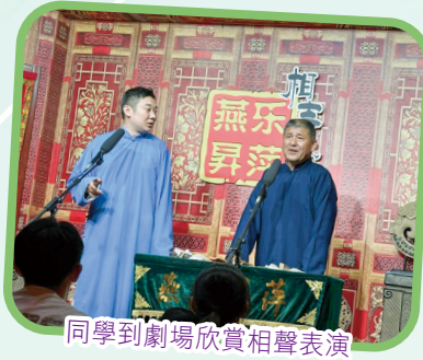
同學到劇場欣賞相聲表演

在六日五夜的行程中，我們於北京市參觀了北京規劃展覽館、大柵欄商業街、故宮博物院、南鑼鼓巷，並與當地居民交流，了解他們的生活，同時到天安門廣場出席升旗禮。此外，我們前往參觀亦莊機械人中心，了解機械人設計及體驗無人駕駛自行車；參觀清華大學期間，更有機會跟清華大學附屬中學學生進行交流。