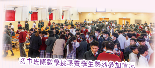
初中班際數學挑戰賽學生熱烈參加情況

2025年初中班際數學比賽已於3月26日（星期三）順利舉行。當天同學們全情投入，師生齊心協力解題。同學們除了收穫參與的樂趣，更從中增進了數學知識，例如幸運數、數列等相關內容。最終，3B班勇奪冠軍，3C班和1C班分別榮獲亞軍與季軍。期望同學們能在趣味盎然的學習氛圍中，建立更堅定的學習信心。