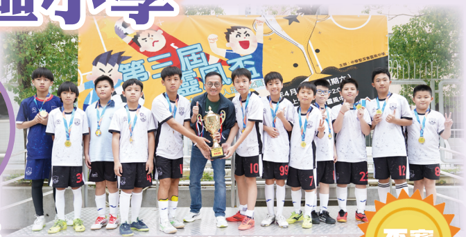
冠軍隊仁濟醫院蔡衍濤小學