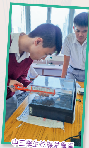
中三學生於課堂學習製作水母缸