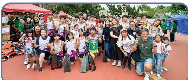
校長、家長和老師到場為參與龍舟比賽的同學打氣