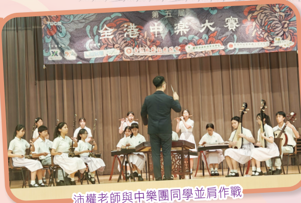
沛權老師與中樂團同學並肩作戰