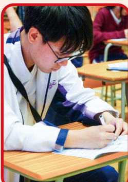
努力為個人企務作規劃

理工大學工程設計學系體驗：「這次體驗，讓我了解到產品設計需要兼顧美學與實用性，讓我對未來的學習目標有了更清晰的方向。」