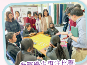
參賽學生專注比賽