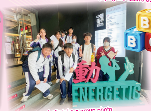
Let's take a group photo