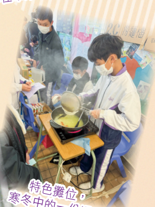
特色攤位，寒冬中的一份溫暖