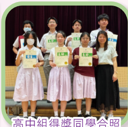
高中組得獎同學合照