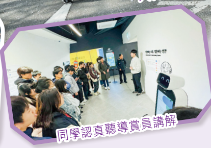
同學認真聽導賞員講解