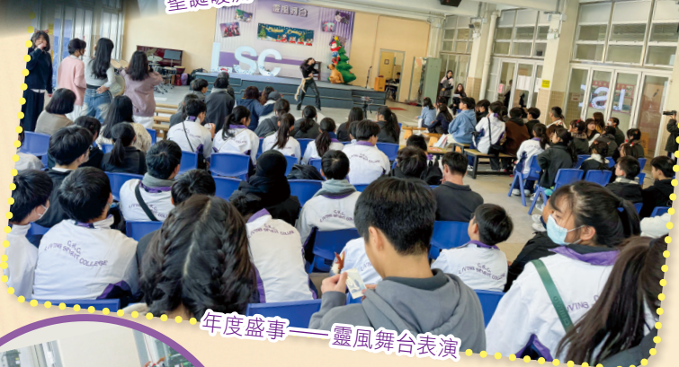
年度盛事——靈風舞台表演