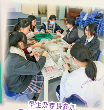
學生及家長參加健環生態瓶製作活動