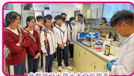
參觀理工大學土木工程學系