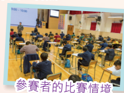
參賽者的比賽情境