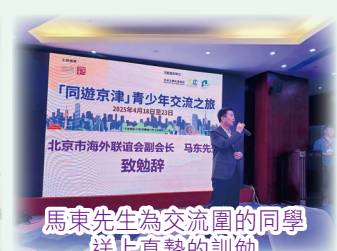
馬東先生為交流團的同學送上真摯的訓勉