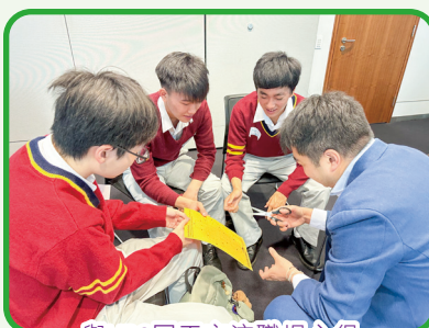
與UBS同工交流職場心得