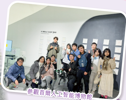
參觀首爾人工智能博物館