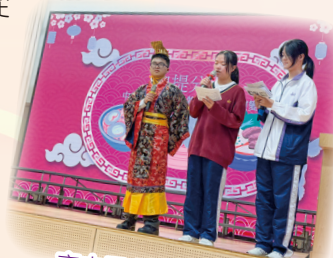
高中同學主持周會