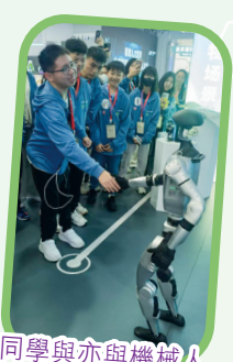
同學與亦與機械人握手問好