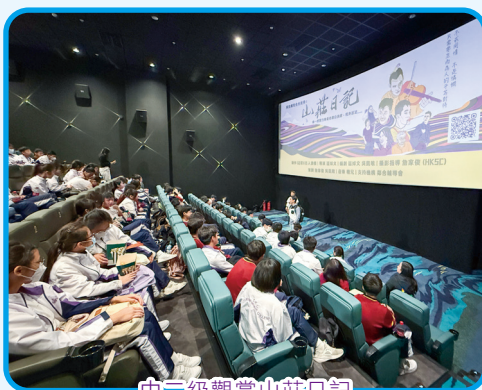
中二級觀賞山莊日記