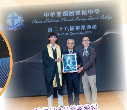
致送紀念品給梁教授