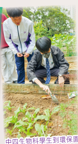
中四生物科學生到環保園學習有機耕種