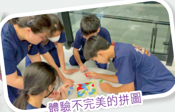
體驗不完美的拼圖