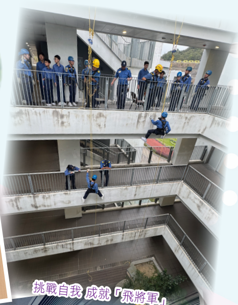
挑戰自我 成就「飛將軍」