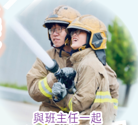
與班主任一起 穿上「黃金戰衣」