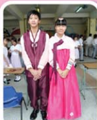
我校友同學穿上韓國人的傳統服飾

學會活動內容以介紹韓國旅遊景點及韓文為基礎，另加上音樂、韓劇、電影、禮儀、習俗、節慶、新聞、兵役制度等方面的分享，以豐富對韓國的知識。