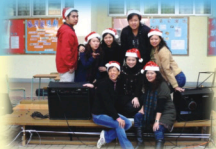
因為你們的精心準備，令這個聖誕充滿了色彩。

接着的聖誕嘉年華更是別具意義，因為攤位的收益都會用作捐助慈善機構，而且負責攤位的同學事前都須要撰寫經營建議書，交給課外活動組老師審批，籌備過程一絲不苟。嘉年華的攤位主要售賣各式各樣食物，當中竟然有傳統街頭小吃：麥芽糖夾餅、碗仔翅，另一邊的中一同學努力叫賣，原來他們的魚蛋、燒賣也是極受歡迎，最後還有家長們親切地為同學製作多種款式的三文治，整個小食部的人群摩肩接踵，萬分熱鬧。