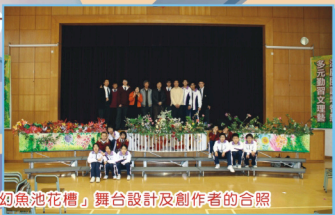
「科幻魚池花槽」舞台設計及創作者的合照