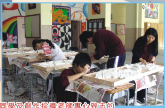
中七同學及創作指導老師專心致志的 在創作「真善美」鑲嵌陶望浮雕壁畫