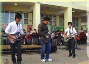
聖誕嘉年華會當日的靈風舞臺，同學在表演band show，吸引不少同學圍觀。

接着的聖誕嘉年華更是別具意義，因為攤位的收益都會用作捐助慈善機構，而且負責攤位的同學事前都須要撰寫經營建議書，交給課外活動組老師審批，籌備過程一絲不苟。嘉年華的攤位主要售賣各式各樣食物，當中竟然有傳統街頭小吃：麥芽糖夾餅、碗仔翅，另一邊的中一同學努力叫賣，原來他們的魚蛋、燒賣也是極受歡迎，最後還有家長們親切地為同學製作多種款式的三文治，整個小食部的人群摩肩接踵，萬分熱鬧。