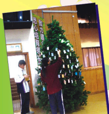
同學們在聖誕樹上掛上心中的祈禱

吃過東西，雖然有點意猶未盡，但是靈風舞臺的表演非看不可。現場已經座無虛席，大家看看照片就知道舞臺四周人山人海。參與演出同學藉此良機大展所長，老師的粉墨登場更為節目添上驚喜，實在是才華盡顯在靈風。