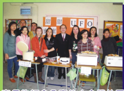
家長教師會負責的小食攤位