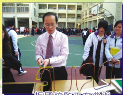
振國校監正在參與聖誕攤位遊戲