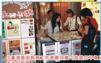
中臺澳藝術教育工作者最欣賞《我是四不像》 作品的創意