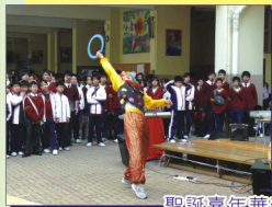
聖誕嘉年華雜耍表演