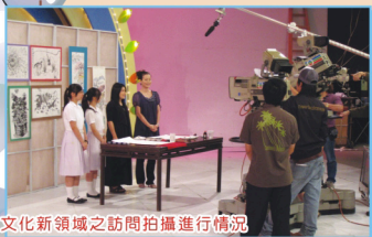
文化新領域之訪問拍攝進行情況