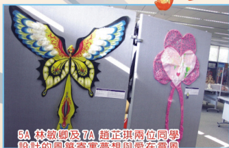
5A 林敏卿及7A 趙芷琪兩位同學 設計的風箏寄寓夢想與愛在靈風 校園吹送