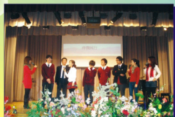
聖誕佈道會Eternity Girls與全校同學同唱詩歌及分享見證。