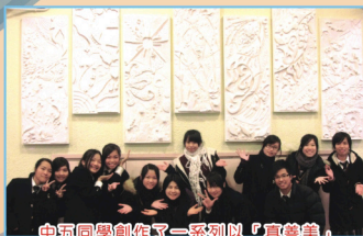
中五同學創作了一系列以「真善美」 作為主題訊息的鑲嵌陶望浮雕壁畫