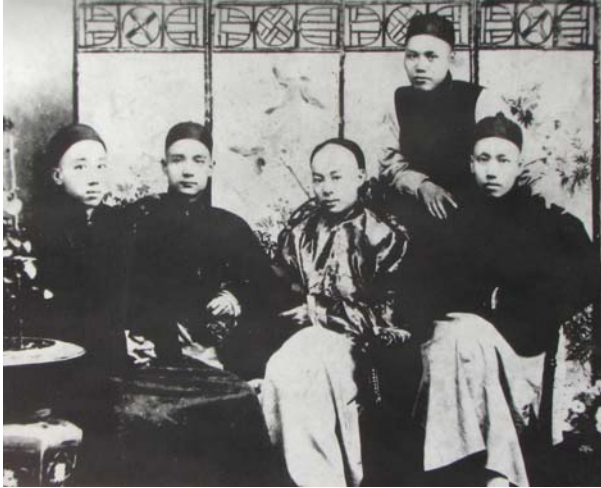
「革命四大寇」相片攝於 1888 年 10 月 10 日 左起：楊鶴齡、孫中山、陳少白、尤列；背站者為 關景良。爲什麼不是「五大寇」？