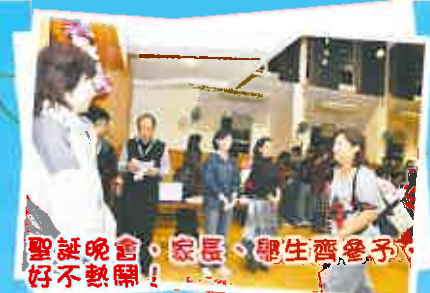
聖誕晚會，家長、學生齊參與，好不熱鬧！

今年的12月19日除了在早上有精彩的聖誕嘉年華，還有晚上由家長團契與大埔堂合辦的「慶祝聖誕家長晚會」。當晚以三齣話劇作主線，配合本校合唱團、樂隊、福音粵曲、敬拜隊及舞蹈的演出；話劇提醒家長要理解子女，懂得彼此多了解及溝通，內容十分有意義，而整個晚會亦充滿著溫馨、寧靜的氣氛。