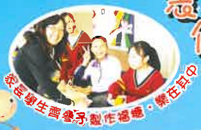
家長學生齊參與製作福糖，樂在其中

是次活動於2月11及12日舉行，初中學生以毛巾、玻璃紙和絲帶製作福糖，並以班際形式進行比賽，這些福糖將會作為通識科學生義工探訪長者的禮物。製作當日場面熱鬧，除了同學們積極投入，還有家長委員的參與，一起用心製作各式各樣、七彩繽紛的福糖，真是令人感動和難忘！