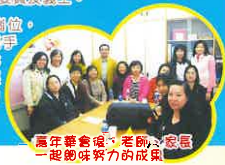
嘉年華會後，老師、家長一起細味努力的成果