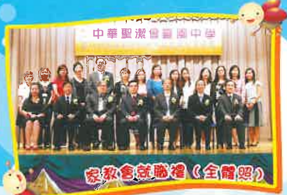
家教會就職禮 (全體照)