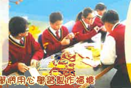
同學們用心學習製作福糖