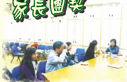
在家長團契大家齊來研習茶道

記得第一次的專題講座是「親子Win Win」，透過資深的導師及社工的分享，讓我重新學習如何處理親子衝突的態度與技巧，令我認識到與子女相處是要不斷更新和建立關係的重要。而忙碌了一天後的我，（因家長團契在每月第一、三個星期五的晚上舉行）雖然帶著一點兒疲勞，但每次都可以很好的享受這個專為家長而設的團契。