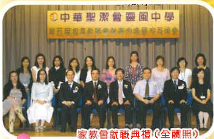
家教會就職典禮(全體照)