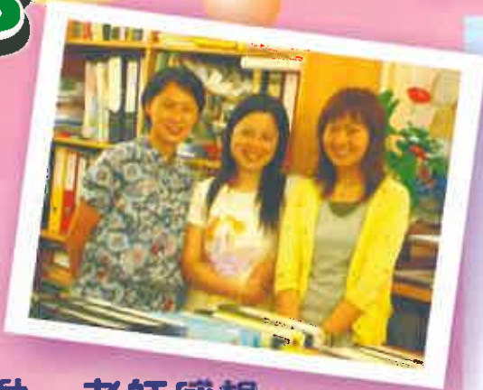
敬師活動 得獎老師合照

所有收回的敬師卡已發回給各位老師，而當中，我們更挑選了個別的感謝語句輯錄於家長暖流，將家長的心意與大家分享。以下是三位得卡最多的老師分享：